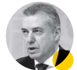
ÍÑIGO URKULLU LENDAKARI DEL GOBIERNO VASCO

Las ferreterías burgalesas han parado la atención al cliente particular, pero siguen atentas ante cualquier petición de material de sus establecimientos que les pueda llegar para ayudar a frenar la pandemia del COVID-19.