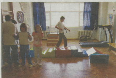
servicios en sus instalaciones de Burgos.