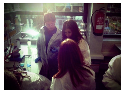
TECNO ARTEA, iniciativa premiada en el Congreso de AETAPI en 2014