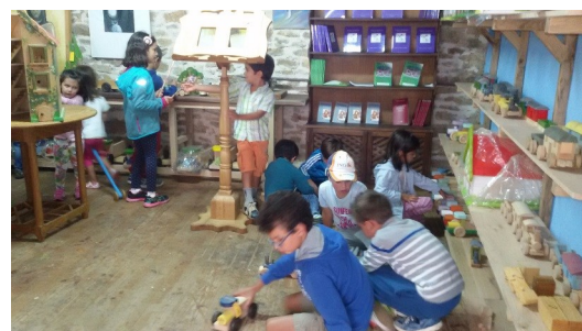
Excursión a la juguetería de madera en Salazar. Escuela de Verano.